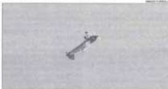
Un dels aparells participants, durant l'actuació d'ahir.

Aquesta última sessió de vols començarà al voltant de les 10.00 hores i està previst que finalitzi cap a les 12.30. Posteriorment, tindrà lloc la cerimònia d'entrega de premis als guanyadors.