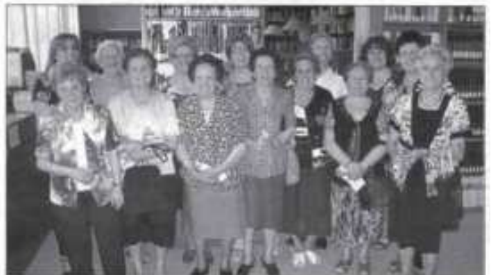
Un grup de padrines d'Alguazas va realitzar ahir una activitat per als petits. Un grup de padrines d'Alguazas, que realitzen un taller de memòria, van explicar ahir als infants com era la tècnica agrícola del seget i el hanc fa més de cinquanta anys.