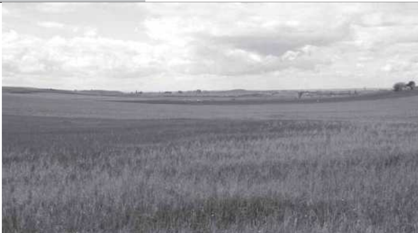
La partida de Vilarnau des del camí de les Canyes

Però tornem al tema lingüístic. Els canvis fonètics i consegüentment gràfics produïts per passar de Mir Arnau o Mirarnau, a Vila Arnau o Vilarnau, són fàcilment explicables, atès que només es tracta de la substitució de la [m] inicial per una [v] que els parlants del català nord occidental pronunciem com una be alta [b] i de la [r] per una [l]. Com que en el primer cas tenim que la [v] pronunciada [b], i la [m] són dues consonants bilabials sonores l'articulació del so d'ambdues és molt semblant i per tant és relativament fàcil la confusió d'un so per l'altre. De manera similar es justificaria la substitució de [r] per [l] per tal com són dues consonants alveolars sonores. Recordeu com, jocosament, es reproduïx el parlar d'un xinès, canviant les erres per eles?