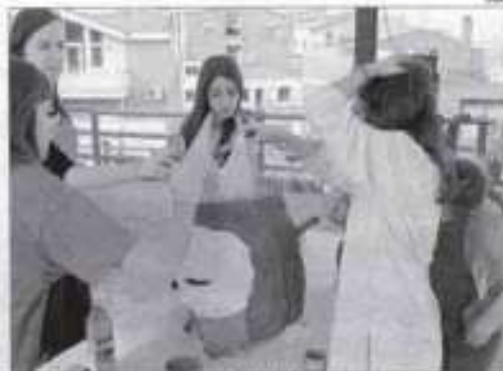
Les figures es van començar a fabricar fa uns mesos.

trobaran el seu moment en l'agenda, en què participen activament les entitats. Tot gratuït, a excepció del campionat de botifarra, que destinarà els 5 euros de la inscripció a La Marató per la Pobresa de TV3.