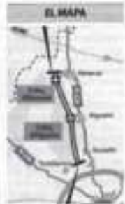
EL MAPA Difícil enllaç en una via amb 6.000 vehicles per dia

El tram de la A-14 no és únic a Lleida. La carretera N-243, entre la Seta d'Urgell i Andorra, havia d'estar enlleïda al maig del 2011 i el ministeri ha anunciat que no la finalitzarà fins al 2013. La A-22, la Lleida-Oceà, té obert el tram entre Lleida i Alcanó, mentre que la variant d'aquesta última població encara s'espera en obres. Tampoc hi ha cap previsió per a l'autovia a Tarragona, mentre que falta el tram Traga-Bajopoma de la A-2.