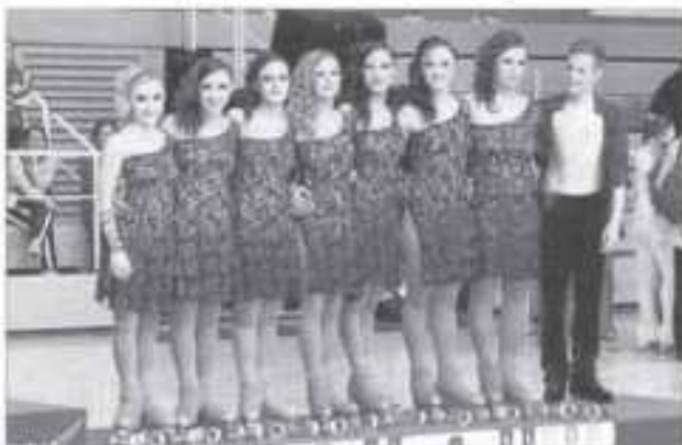
Aquesta és l'equip de nou del CP Arnedo que participà als campionats d'Europa.