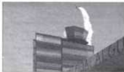
Alguns dels participants degaren per a Lleida

El campionat de vol acrobàtic es va celebrar a l'aeroport d'Alguaire, on va participar més de 100 pilots de tota Espanya. El campionat va començar ahir i acabarà demà.