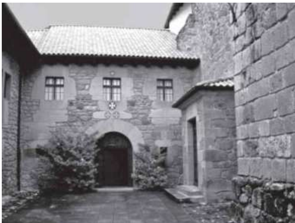
Real Monasterio de San Juan de Acre

Los otros como son Junqueras, S. Pedro, Sta Clara, Valdonzella, son de Sras relixiosas que biben en sus casas con criadas, y en estos no ai mas casas que las que son menester para las señoras que las abitan, y este Conbento en el ultimo sitio an sido tan malparados que a sido forzoso el redificar en ellos lo bastante para que con la menos incomodidad quisiesen volber en ellos las Sras. Relixiosas, con que es imposible restituir en ninguno de los Conbentos una sola Relixiosa en Alguaire, con que .es imposibilitada la consecuzion de lo ordenado por