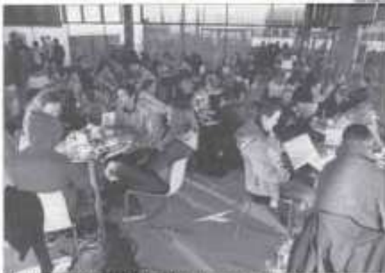
El vol de Manchester del març va arribar amb retard i els passatgers van esperar a la cafeteria.

L'ENTRADE L'AVUI I EL SEU SUPPLEMENT LLEIDA I COMARQUES treballa a l'empresa britànica Thomas Cook, amb la intenció de portar a la primavera i estiu del 2013 una oferta turística diversificada al punt d'origen que inclourà vols de set, abaratiment i la prestació d'un o més serveis d'acompanyament al Turisme de Lleida, una iniciativa impulsada de la comunitat de Lleida. Aquesta iniciativa té el suport de Thomas Cook operant des del seu aeroport d'Alguaire i, a més, a l'aeroport de Lleida, que ofereix un servei d'acompanyament al Turisme de Lleida, una iniciativa impulsada de la comunitat de Lleida.