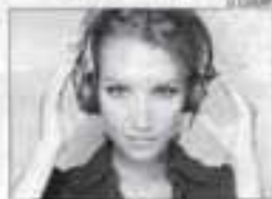
Luxury punxarà avui.

L'animació per als nens, la missa o el recorregut de caça