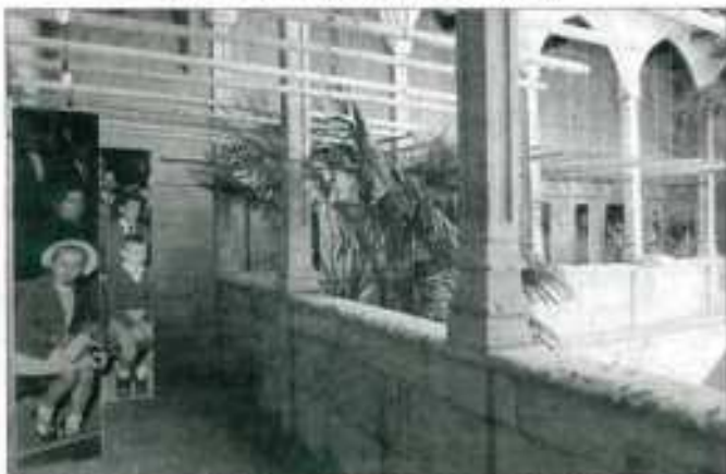
L'IES dedica una exposició al Santuari de la Mare de Déu del Mont d'Alguazas. L'Institut d'Ensenyament Secundari de l'any de 1964 a una exposició sobre el Santuari de la Mare de Déu del Mont d'Alguazas, amb una reproducció de l'obra de l'artista català i un treball de la mà de l'Alguazas.