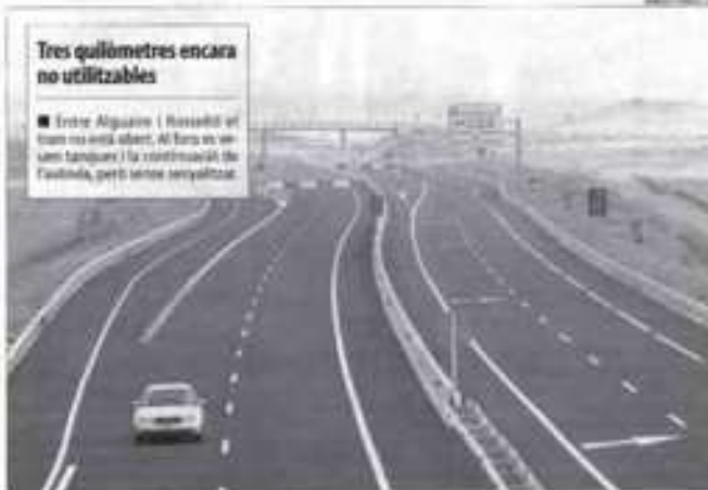
Tres quilòmetres encara no utilitzables

A més, no hi ha cap calendari per fer el tram de Lleida a Rosselló (que va ser adjudicat a l'abril del 2009) ni i que posteriorment el contracte es va anul·lar per les retards en la adjudicació ni tampoc preveia per adjudicar la part entre Almenar i el límit de província per Lleida. No es va començar pel primer tram, de Lleida a Rosselló, perquè no estava decidida la connexió amb la A-2 a Terres-