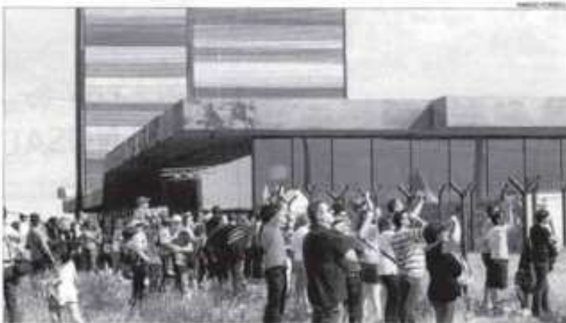
Nombrosos espectadors van acudir ahir a Alguaire per presenciar la competició.

La segona jornada d'aquest Campionat d'Espanya, a més de disputar-se sota unes perfectes condicions meteorològiques, va comptar amb la presència de nombros públic, que es va aturar a l'aeroport d'Alguaire per seguir les victòries acrobàtiques dels